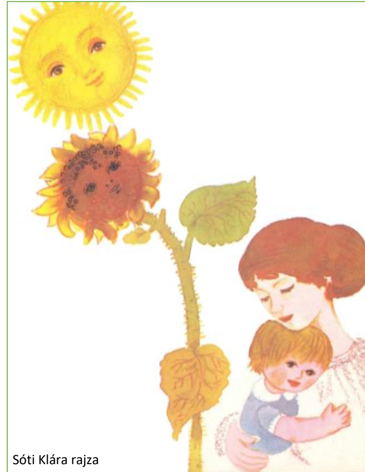
Sóti Klára rajza

Édes...ny...m, vir...gos...t ...lmodt...m, n...pr...forgó vir...g volt...m ...lmomb...n, édes...ny...m, te meg fényes n...p volt...l, n...pkeltétől n...pnyugt...ig r...gyogt...l.